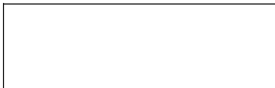
Схема границ эксплуатационной ответственности сторон

Прочие сведения по установлению границ раздела эксплуатационной ответственности сторон _____.